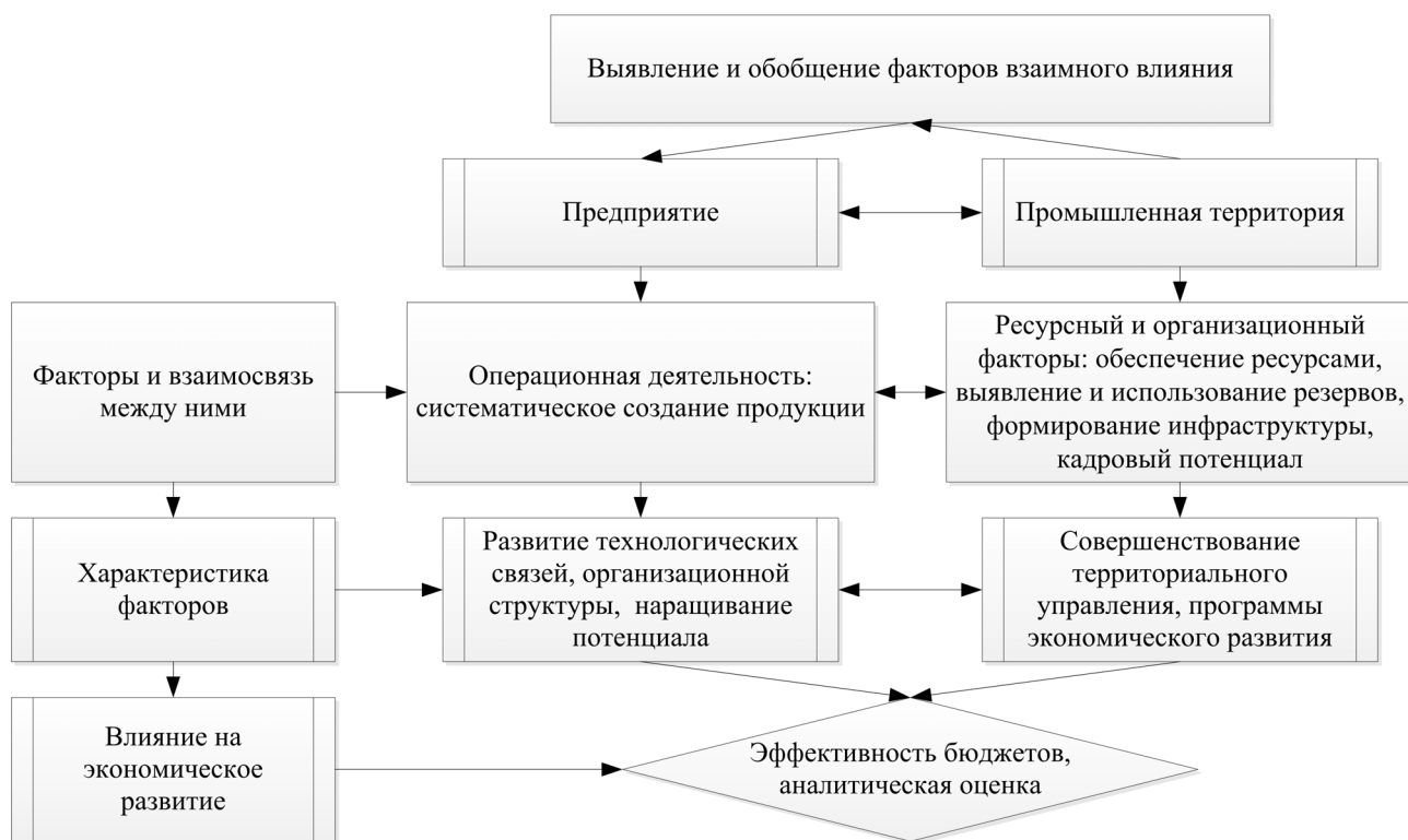
Рис. 1. Влияние и обобщение факторов взаимного влияния предприятия и промышленной территории

б) для промышленной территории – «ресурсный» и «организационный» факторы: обеспечение ресурсами, выявление и использование резервов, формирование инфраструктуры, кадровый потенциал, для которых характерным является совершенствование территориального